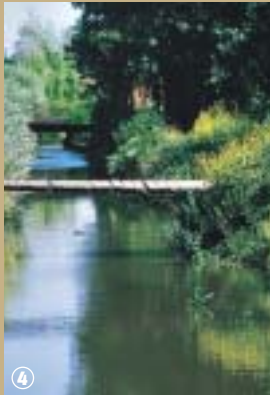
Marais du Nieurlet.

L'une des forces de l'Homme est qu'il sait s'adapter aux conditions naturelles de son environnement et il le prouve encore une fois avec l'exploitation du marais audomarois.