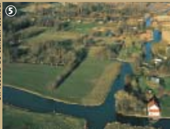
Un réseau de canaux étendu.

motorisation des embarcations, l'unique mode de transport à travers le marais. On y serpente dans un labyrinthe de canaux, où émergent quelques légers, ces langues de terres dédiées à la culture du chou-fleur et de l'endive. Certains se lancent dans le tourisme et font partager leur amour pour ce mode de vie au fil de l'eau, comme le prouvent ces maisons pittoresques, isolées au milieu du marais, à peine reliées au monde par un petit bac à chaîne.